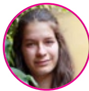
pályázati koordinátor, szerző: Tóth Renáta Anna