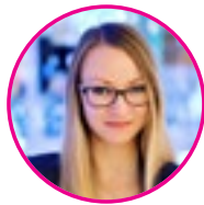
szerző: Tóth Nóra