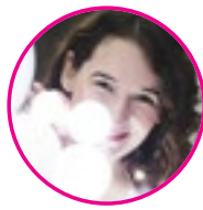
szerző: Bugovicsné Géczy Ráhel