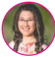
szerző: Csatári Fanni