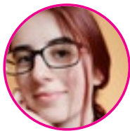
szerző: Tóth Petra