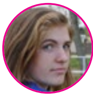
közösségi média képszerkesztő: Ferenczi Dóra