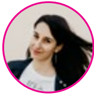
szerző: Matuska Mircsi