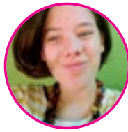
szerző: Terecskei Aliz