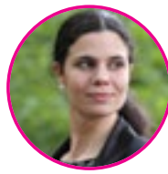
szerző: Gyémánt Tímea