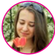
szerző: Ónodi Krisztina