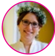
szerző: Nagyné Végh Csenge